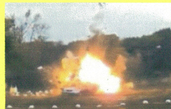
爆発物の威力【警察庁作成】

「ちょっとおかしいぞ」は警察に連絡・相談。 皆さんの通報がテロの未然防止に繋がります。