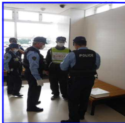
侵入者確保の状況