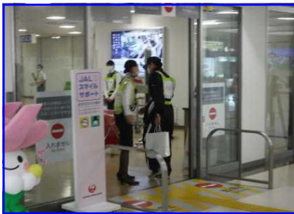
不審者の侵入状況