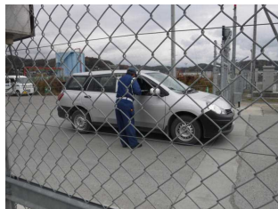
入場者チェックを強化