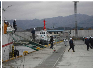
作業員を避難誘導