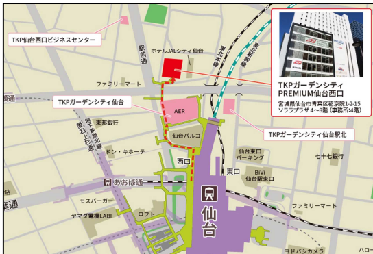
【アクセス】JR東北本線 仙台駅 西口 徒歩3分