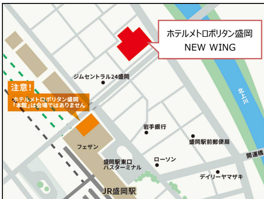
【アクセス】JR盛岡駅北口 徒歩3分