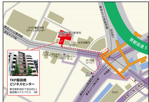
【アクセス】JR総武線 飯田橋駅 東口 徒歩3分