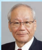
横倉義武共同代表